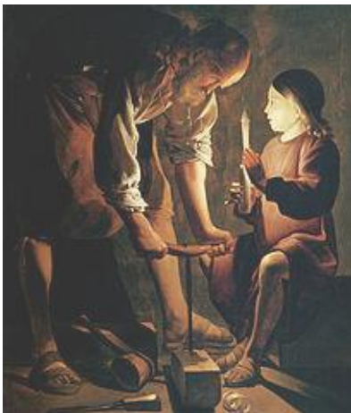
Georges de La Tour Św. Józef cieśla