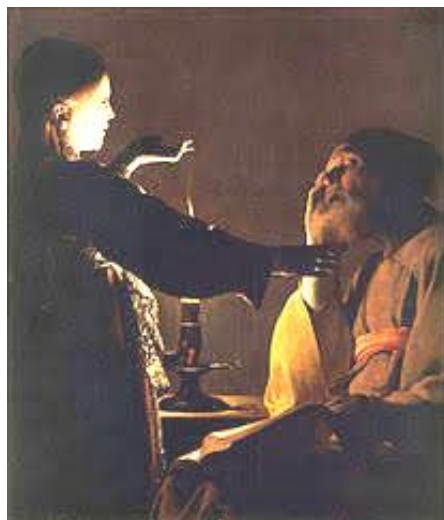
Georges de La Tour Sen Świętego Józefa