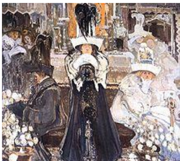
Witold Wojtkiewicz Medytacje .