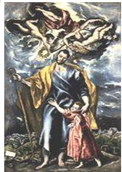
Greco Święty Józef z Dzieciątkiem Jezus